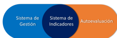
Ilustración 1. Sistema de Aseguramiento de la Calidad

El Sistema de Gestión: está constituido bajo las directrices de la norma ISO 9001:2015, bajo estos lineamientos se garantiza que los procesos institucionales se soportan documentalmente a través de políticas, procedimientos, formatos, guías; que se desarrollan a través del ciclo PHVA, lo que implica que todas sus actividades se planean, se ejecutan en un flujo de trabajo claro, se evalúan tanto interna como externamente por diferentes grupos de interés y que el resultado de estas evaluaciones se usa para definir acciones preventivas y de mejora del sistema, así como también se garantiza que la institución desarrolla su gestión bajo un pensamiento basado en riesgos.