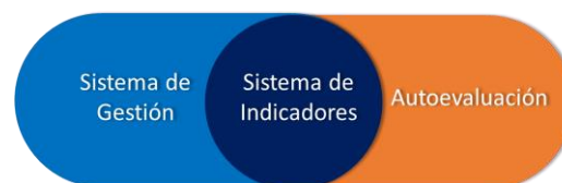
Ilustración. Sistema de Aseguramiento de la Calidad

El Sistema de Gestión: está constituido bajo las directrices de la norma ISO 9001:2015, bajo estos lineamientos se garantiza que los procesos institucionales se soportan documentalmente a través de políticas, procedimientos, formatos, guías; que se desarrollan a través del ciclo PHVA, lo que implica que todas sus actividades se planean, se ejecutan en un flujo de trabajo claro, se evalúan tanto interna como eternamente por diferentes grupos de interés y que el resultado de estas evaluaciones se usa para definir