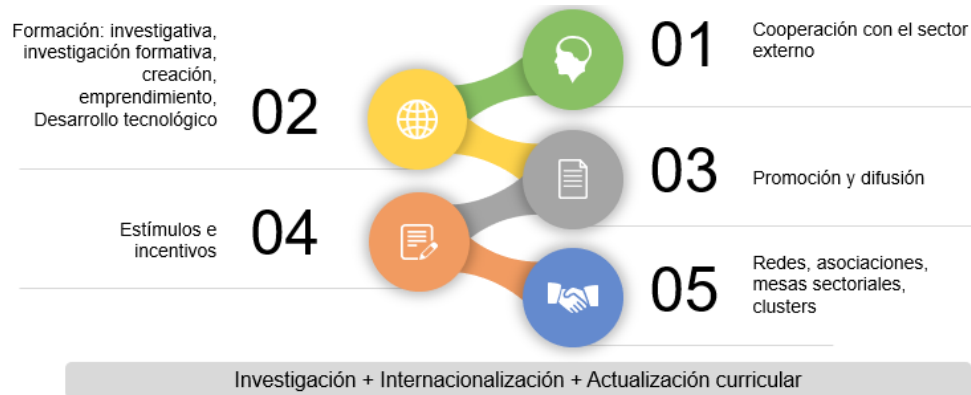
Ilustración. Estrategias de fomento para la investigación, la innovación y la creación artística y cultural

Fuente. Dirección de Investigaciones (2022)