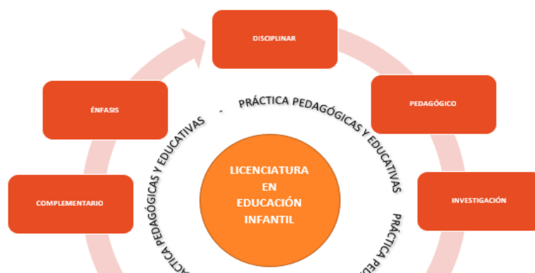
Figura 2. Esquema curricular Licenciatura en Educación Infantil

Para responder a estos retos, el programa ha diseñado su estructura a partir de seis componentes y un énfasis que están centralizados en el desarrollo de las prácticas pedagógicas y educativas, en tanto se considera que este proceso se constituye en sí mismo un escenario de aprendizaje, que fundamenta y fortalece el saber y quehacer docente.