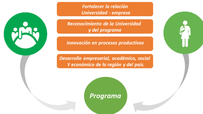
Ilustración 2. Prácticas en el programa de Diseño Visual

En este esquema los tres actores: empresa, programa y estudiante, se benefician en el ejercicio de la práctica empresarial, dado que se fortalece no solo la relación universidad – empresa, sino también, el crecimiento y fortalecimiento de los procesos productivos de las organizaciones, gracias a los conocimientos proporcionados por los estudiantes, quienes, desde su perspectiva, aportan al desarrollo empresarial, académico, social de la región y del país.