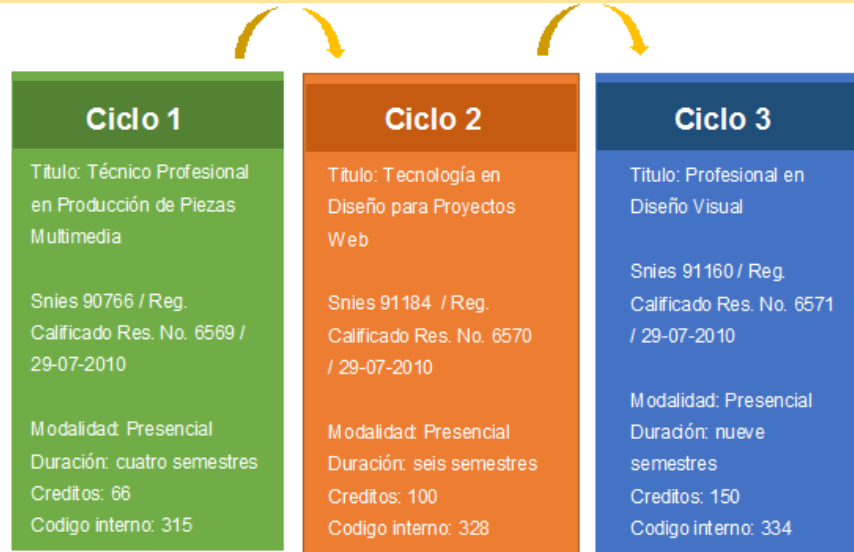
Ilustración 1. Ciclos propedéuticos del programa en Diseño Visual de Unipanamericana.